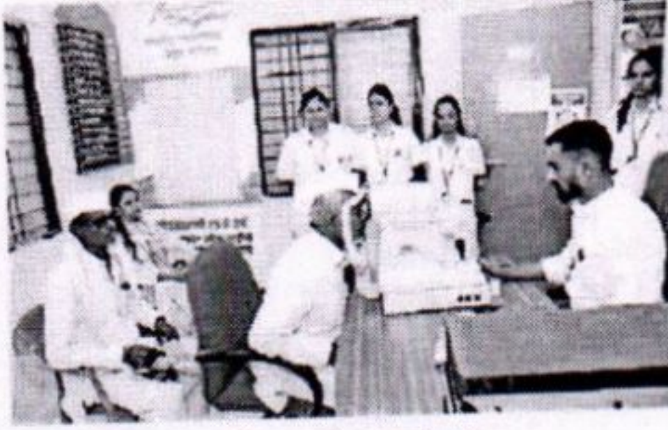
दिघवड येथील शिबिरात रुग्णांची तपासणी करताना डॉक्टर.